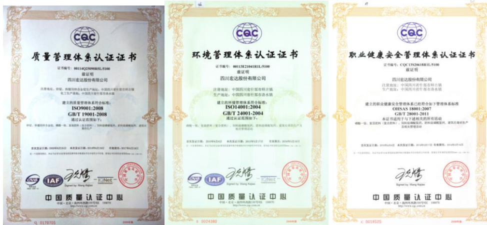
ISO14001/ OHSAS18001/ ISO9001 证书